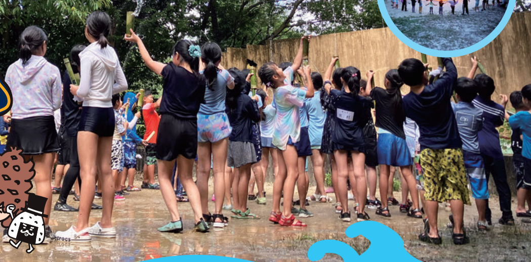
写真はこれまでのキャンプの様子です